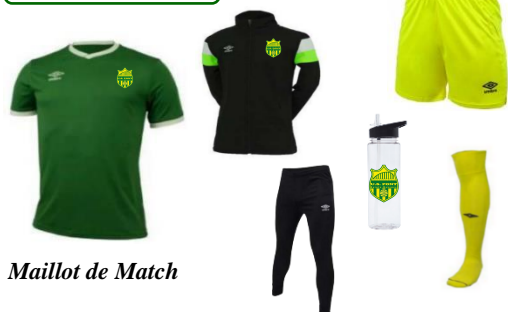
Maillot de Match